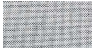
Bianco e nero

Puoi inserire una grafica a piacere o utilizzare una delle tantissime proposte: